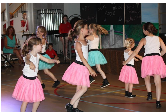
De majorettes in actie.

Vlak voor de vakantie vindt ieder jaar ons jeugdconcert plaats. Een mooi moment om aan alle papa's, mama's, opa's, oma's en andere fans te laten horen en zien wat het afgelopen jaar allemaal geleerd is. Helaas kon "Excelsiors Speelkwartier" door het slechte weer niet op het schoolplein plaatsvinden, maar de grote zaal in het Pelkpark was een goed alternatief. Alle muzikanten en majorettes hebben een spetterend optreden gegeven. Juf Wilma en Meester Kees hebben de middag op een leuke manier aan elkaar gepraat en aan het eind zelfs nog diploma's uitgedeeld aan onze muzikanten van "Muziekpret" en danseressen van "Dance & Twirl".