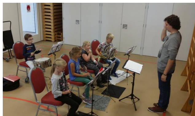
Onze jongste muzikanten van Pretteketet. Ze zijn net begonnen aan de muziekschool en maken nu al samen muziek!

Heb je vragen en/of opmerkingen schroom niet ons te benaderen. Sterker nog, we kunnen niet zonder.