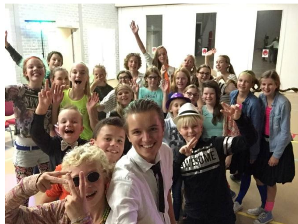
De Ranjacommissie organiseerde een "foute party". Het was supergezellig!