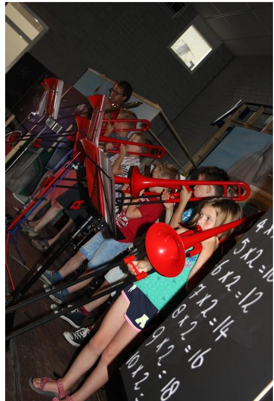
Een hele rij Excelsior-rode "p-bones"!